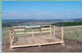
Eifelblick „Am Apert“

Die wellige Landschaft um Wallersheim, Büdesheim und Schwirzheim ist Teil der größten Kalkmulde in der Eifel. Sie ist reich an Versteinerungen und weist weitgehend vollständige Gesteinsschichten aus der Zeit des Devons vor etwa 400 Millionen Jahren auf. Eine abwechslungsreiche Wanderung und interessante Stationen sind hier garantiert.