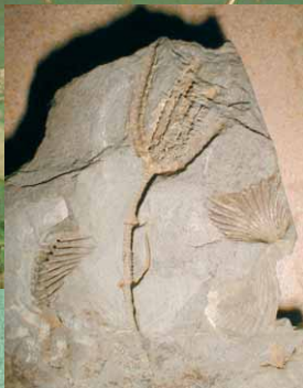
Versteinerte Seelilie aus dem Unterdevon (ca. 350 bis 400 Millionen Jahre alt).