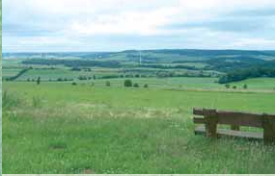
Typische Kalkmuldenlandschaft zwischen Schwirzheim und Büdesheim mit Wechsel von Wald und Weiden.

Die wellige Landschaft um Wallersheim, Büdesheim und Schwirzheim ist Teil der größten Kalkmulde in der Eifel. Sie ist reich an Versteinerungen und weist weitgehend vollständige Gesteinsschichten aus der Zeit des Devons vor etwa 400 Millionen Jahren auf. Eine abwechslungsreiche Wanderung und interessante Stationen sind hier garantiert.