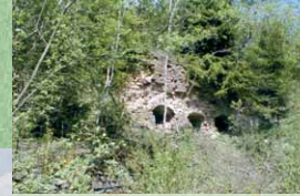
In diesen historischen Kalköfen wurde Kalk gebrannt, der z.B. für die Herstellung von Mörtel und Farben Verwendung fand.

Durch den nordöstlichen Teil der Prümer Kalkmulde führt Route 3 der Prümer Land Tour. Und hier hat die Landschaft viel zu erzählen, sei es aus vorgeschichtlicher Zeit oder der eher jüngeren Vergangenheit, die sich mit historischen Wegkreuzen oder längst aufgegebenen Kalköfen in Erinnerung bringt.