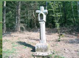
Das „Blutkreuz im Walde“ bei Büdesheim

Der größte Teil der Strecke führt durch offenes Gelände, seltener durch Wald. Zumindest im Sommer sollten Sie deshalb einen Sonnenschutz und Getränke für unterwegs nicht vergessen.