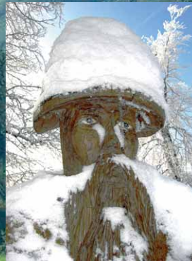
Der „Schwarze Mann“

Faltblätter mit Detailkarten zu den vier Routen erhalten Sie bei der Tourist-Information Prümer Land, der Infostätte „Mensch und Natur“ in Prüm und bei den örtlichen Ämtern. Wir wünschen Ihnen einen erlebnisreichen Aufenthalt!