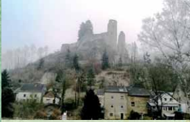
Am Rand der „Schönecker Schweiz“ liegt der namensgebende Ort Schönecken mit seiner weithin sichtbaren Burg.

Die Eifel ist Teil des Rheinischen Schiefergebirges, man findet hier Gesteine aus fast allen Epochen der Erdgeschichte. Dies ist ein Grund für ihre landschaftliche Vielfalt und ihren Reiz. Aber auch menschliche Spuren tragen dazu bei: von vorgeschichtlichen Siedlungsplätzen über Burgen und Klöster bis hin zu malerischen Ortschaften. Eingebettet liegen sie in einer abwechslungs- und waldreichen Landschaft.