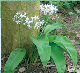
Der Bärlauch gehört zu den Frühblüheren der Kalkbuchenwälder

Die Eifel ist Teil des Rheinischen Schiefergebirges, man findet hier Gesteine aus fast allen Epochen der Erdgeschichte. Dies ist ein Grund für ihre landschaftliche Vielfalt und ihren Reiz. Aber auch menschliche Spuren tragen dazu bei: von vorgeschichtlichen Siedlungsplätzen über Burgen und Klöster bis hin zu malerischen Ortschaften. Eingebettet liegen sie in einer abwechslungs- und waldreichen Landschaft.