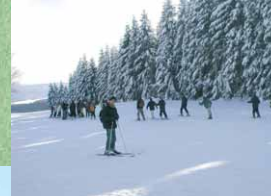
Wintersport in der Schneifel

Das Prümer Land bietet eine Fülle von Möglichkeiten, einzigartige Natur zu erleben. Streifen Sie durch die wellige Landschaft der Prümer Kalkmulde, besuchen Sie den historischen Bergbau bei Bleialf oder die zu allen Jahreszeiten attraktive Schneifel. Mit vier ausgesuchten Routen laden wir Sie ein zum Wandern!