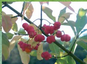
Leuchtend rote Früchte des Pfaffenhütchens