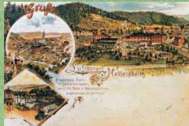
Postkarte mit Ansicht der Kneipp'schen Kuranstalt, um 1900

Als eines der wenigen Eifeldörfer besaß Nettersheim ehemals drei Burganlagen. Nachdem Nettersheim 1871 an die Bahnlinie Köln - Trier angeschlossen worden war, erlebte der Ort um 1900 eine kurze Blüte als Kneipp'sches Kurbad.