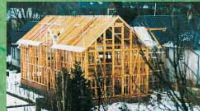
Holzkonstruktion, Anbau Naturschutzzentrum Eifel

Die behutsam restaurierte historische Bausubstanz spiegelt die traditionelle Wohn- und Wirtschaftsweise der Dorfbewohner wider. Das Dorfbild wird geprägt durch ehemals landwirtschaftlich genutzte Fachwerk- und Bruchsteinbauten. Typische Bauform ist die Winkelhofanlage aus Wohnhaus und im Winkel dazu angeordnetem Stall- und Scheunentrakt.