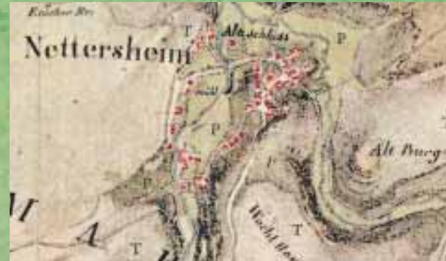
Kartenaufnahme durch Tranchot und v. Müffling, ca. 1809

Das heutige Erscheinungsbild des Dorfes Nettersheim ist das Ergebnis einer jahrhundertelangen Entwicklung und Besiedlung. Nach den Kelten lebten die Römer im Raum Nettersheim, von denen noch heute Tempelanlagen, Eifelwasserleitung und andere archäologische Denkmäler zeugen. Die Franken legten im frühen Mittelalter den Grundstein für die heutige Siedlungsstruktur des Ortes.